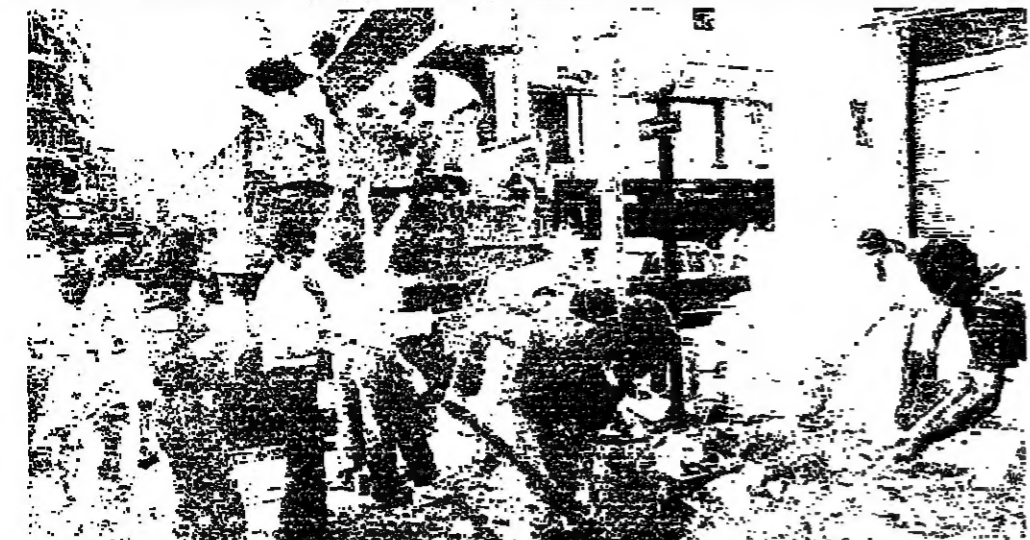
صيات وشبان يساهمون في رفع القنصات من الجمرات

قال نائب رئيس حزب الكتائب السيد جوزف شاهر امس، ان الكتائب تطلب بصارم من رئيس الحكومة، ان يقول كل ما يحدث، ومن بين الفترات يخرق وقف إطلاق النار، ولا يتخذ بالاتصالات المحروقة.